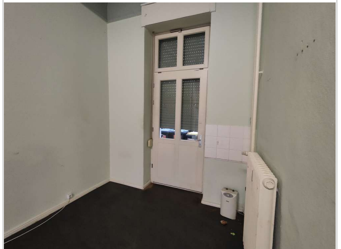
Ausgang zum Hof