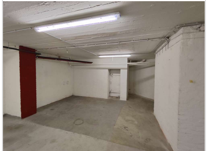
UG / Keller