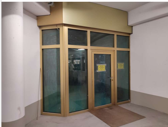
Ausgang zum Parkhaus