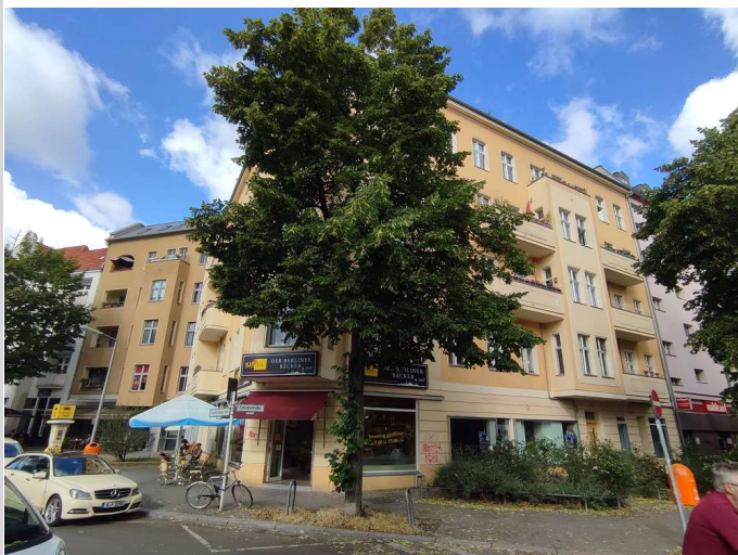
Umfeld zeigt nicht das Objekt

Miet-/Kaufobjekt: Miete Verkaufsfläche: 65,00 m 2 Gesamtfläche: 74,00 m 2 Miete pro Monat: 1.400,00 EUR