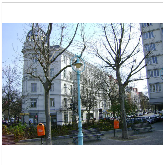
Umfeld zeigt nicht das Objekt