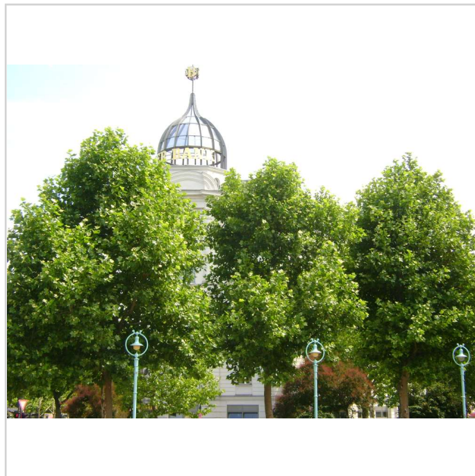
Umfeld zeigt nicht das Objekt

Verbindung setzen, die ein für den Vermieter genehmes Nutzungskonzept angeben !